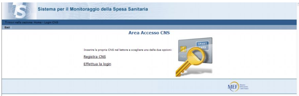
Figura 2 - Menù CNS